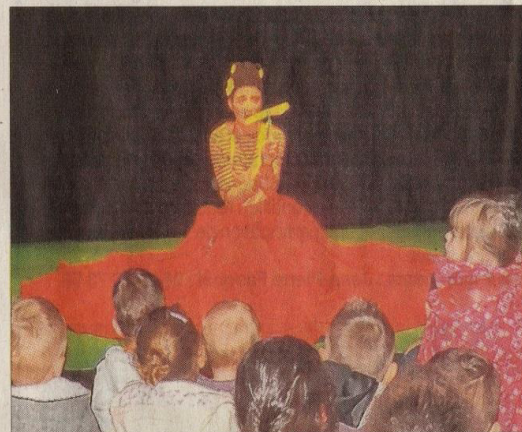
Devant la salle des Cordeliers, les nounous de l'Enclave et leurs petits bouts de chou. Melli l'abeille se trouve confronté au problème de pollution de la nature.

Lundi, dans le cadre du festival familial ToutiFesti organisé par le Théâtre du Rond-Point, les deux Ram (Relais assistantes maternelles) de la Communauté de communes